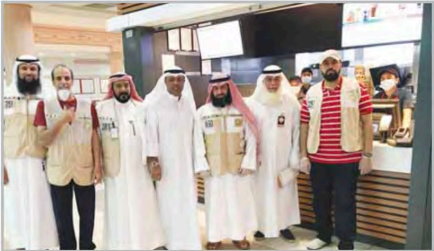
■ علي الكندري يتفقد مطاعم منطقة حولي

■ أشاد نائب رئيس الهيئة العامة للغذاء والتغذية صالح الحميضي بالجهود التي تقوم بها المراكز الرقابية التابعة في الهيئة عن طريق الجولات الميدانية على الأسواق المركزية والمحال المتخصصة في بيع المواد الغذائية، مثنيا الدور الكبير الذي يقوم به موظفي هيئة الغذاء والعمل على مدار الساعة. وقال الحميضي في تصريح صحافي أمس إن