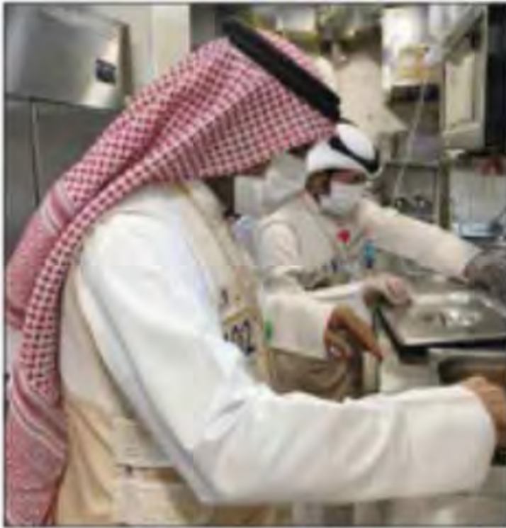
جانب من تحرير المخالفات