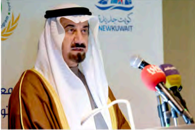
مدير عام الهيئة العامة للغذاء والتغذية الكويتية يلقي كلمته