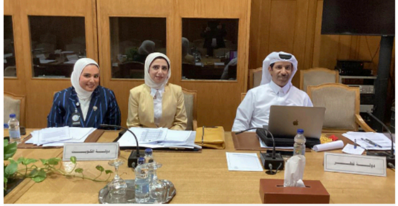
الوفد الكويتي المشارك في الاجتماع (12) للفريق العربي لسلامة الغذاء