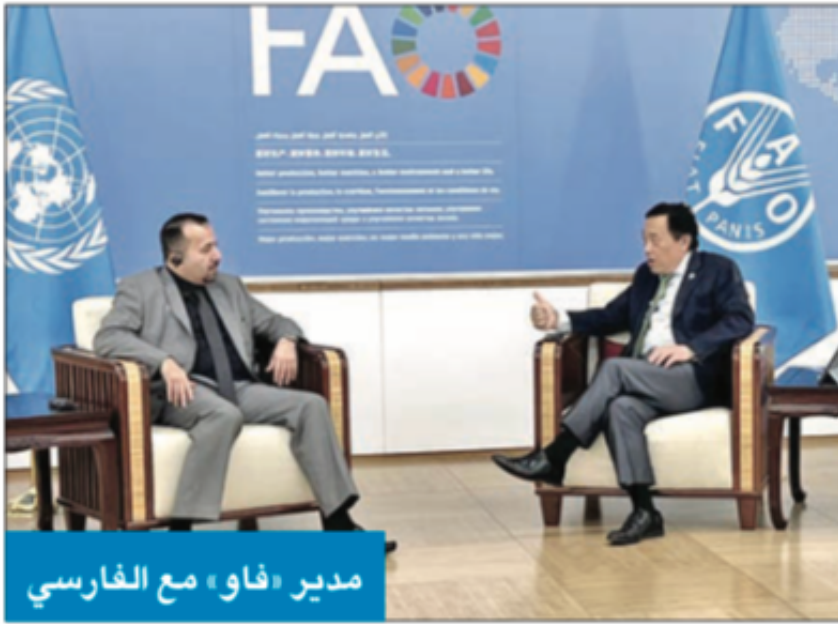
مدير «فاو» مع الفارسي

هيئة الزراعة: بلورة استراتيجية جديدة للإنتاج الغذائي والتشجير